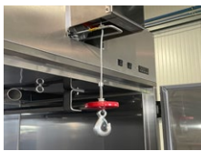
Inklusive Schweißwanne aus Edelstahl